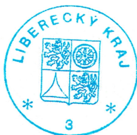
Martin Půta hejtman Libereckého kraje

Záznam o vyvěšení na úřední desce Krajského úřadu Libereckého kraje včetně vyvěšení způsobem umožňujícím dálkový přístup: